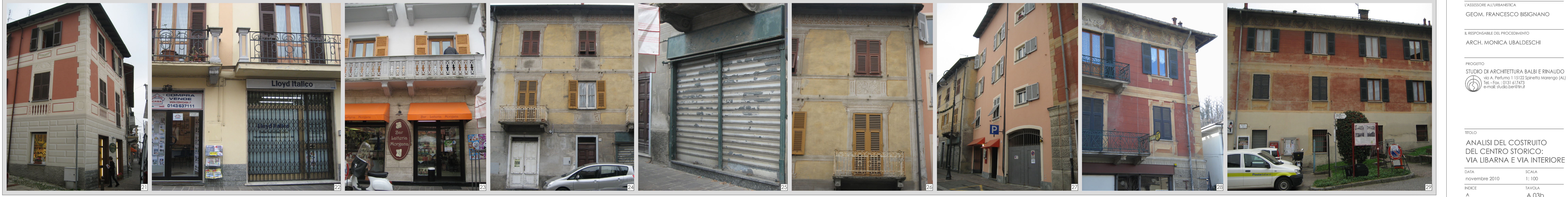
Via Libarna: tratto p.za S. Rocco/Piazza Nuova, fronte sud-est

NOTA: Gli edifici analizzati in questa tavola possono essere individuati nella tavola R.03 "RILEVIO VIA LIBARNA E VIA INTERIORE"