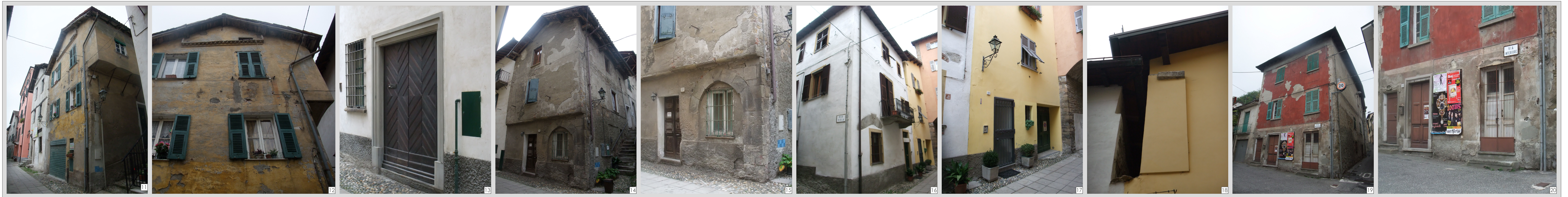
Via Interiore: tratto p.za S. Rocco/Piazza Nuova, fronte sud-ovest