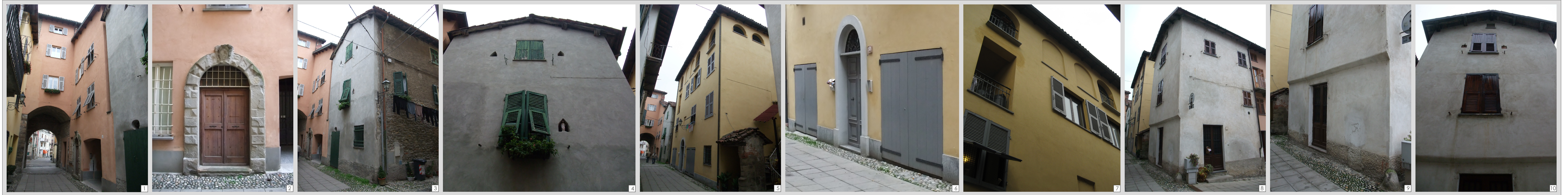
Via Interiore: tratto p.za S. Rocco/Piazza Nuova, fronte nord-est